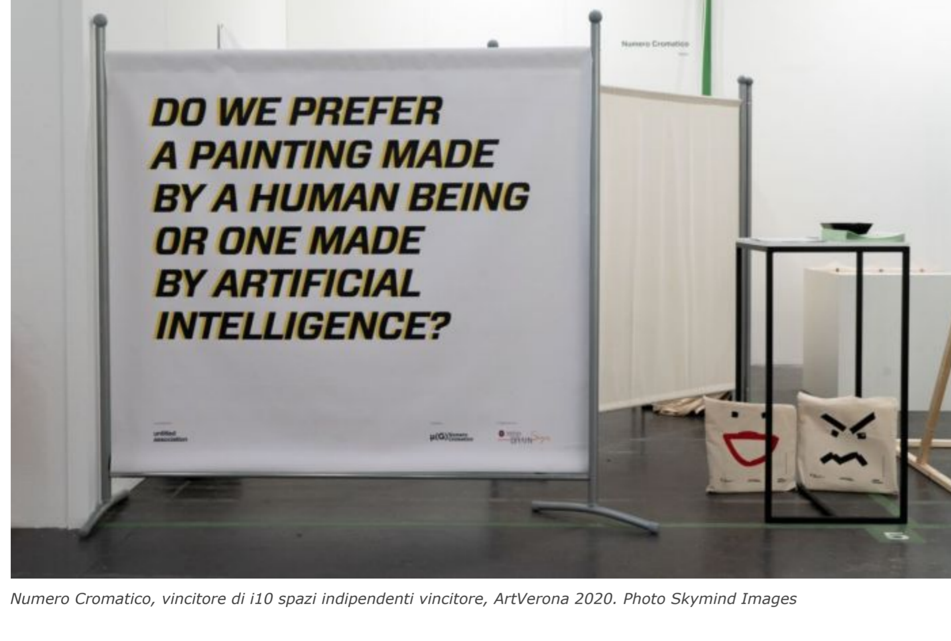
Numero Cromatico, vincitore di 110 spazi indipendenti vincitore, ArtVerona 2020.

FOCUS SUL CENTRO DI RICERCA NUMERO CROMATICO, NATO A ROMA NEL 2011 E COMPOSTO DA RICERCATORI PROVENIENTI DALL'ARTE E DALLE NEUROSCIENZE.